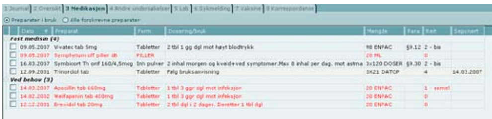
Medikasjon: Enkelt å veksle mellom visning av preparater i bruk og alle forskrevne preparat