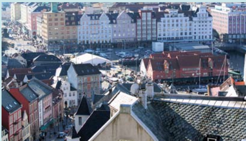
Februarsol på fisketorget